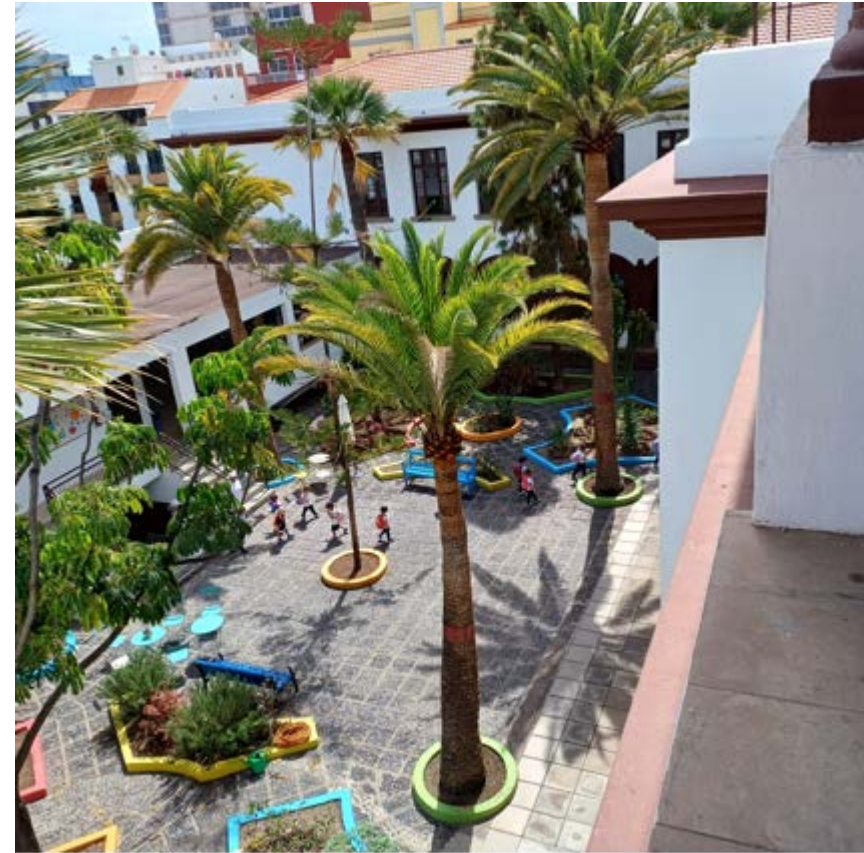
Patio del Colegio