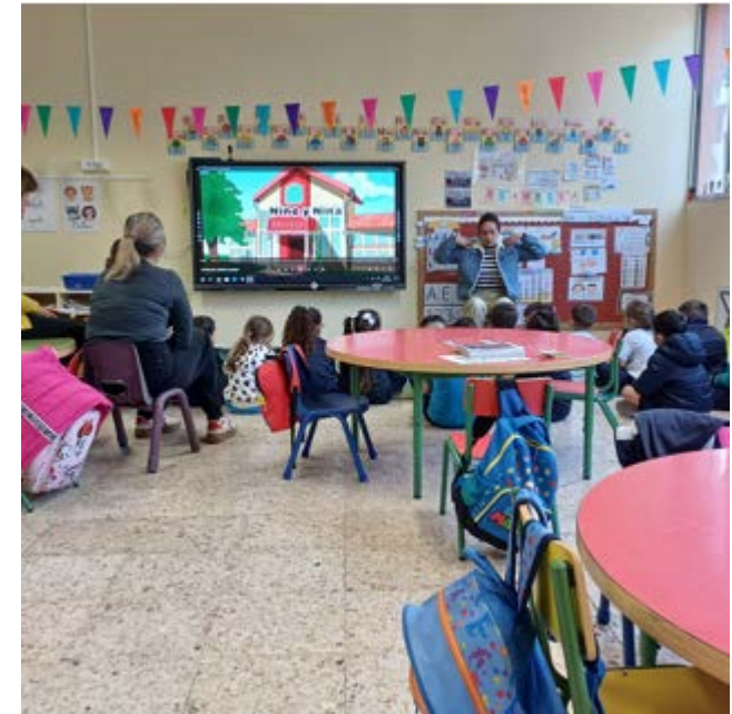
Varios niños con TEA y problemas de integración