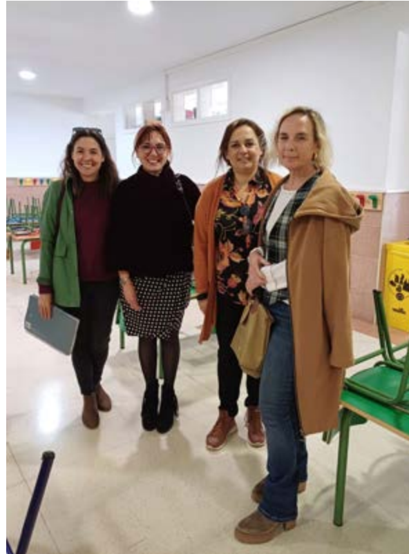
Directora del colegio y psicóloga de Prevenir